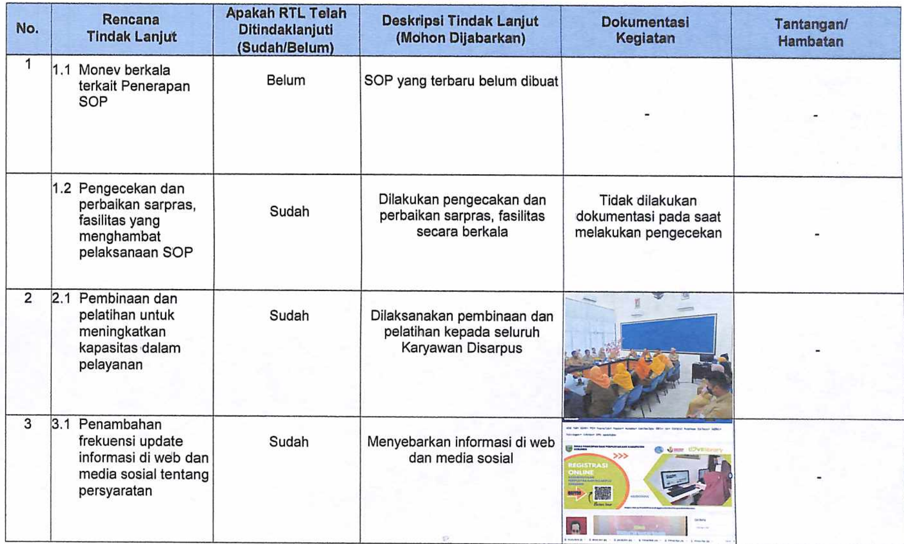
Tabel 3.2 Realisasi Rencana Tindak Lanjut Survei Kepuasan Masyarakat Triwulan II Tahun 2024